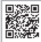
(お申込み用QRコード)